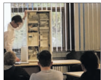
Die Auszubildenden informierten sich direkt bei den Herstellern zu Produkten.