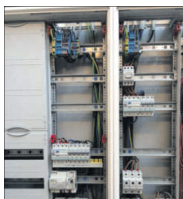
Von der modernen Spülmaschine bis zum Schaltschrank: Elektro Erb ist der Ansprechpartner.